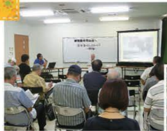
語やびら、イガルーシマ 〜宇宜野湾編〜(2018年)