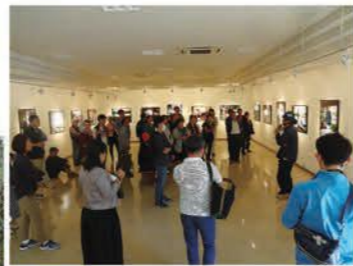
石川竜一写真展の ギャラリートーク (2018年)