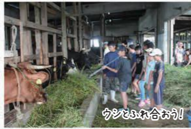
ウシとふれ合おう!