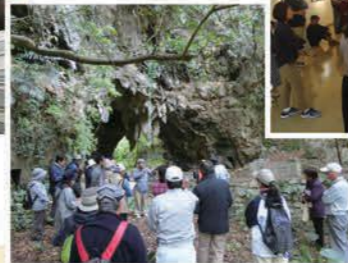
疎開先を訪ねて 〜今帰仁村〜(2017年)

月に1、2回開催しています。室内講座(定員50名)から野外巡見(定員25名)まで、多彩なメニューです。新しい宜野湾を発見してみませんか!