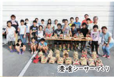
漆喰シーサーづくり