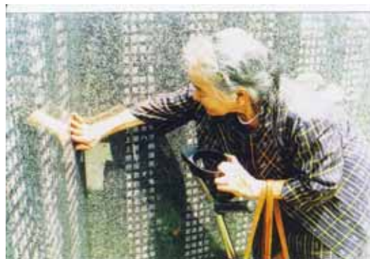
平和の礎に刻まれた家族の名前をやさしく手でさする老婦人。