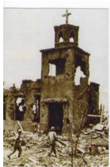
教会も攻撃の対象に・・・。