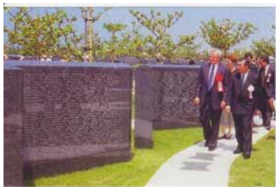
1995年6月、当時のモンドール駐日大使が平和の礎を視察。

多くの犠牲者を出した沖縄戦に続き60年間にわたり米軍基地負担を背負わされてきた沖縄県民に対して米国は優先して基地を返還し、沖縄の米軍基地負担の軽減を図るべきです。