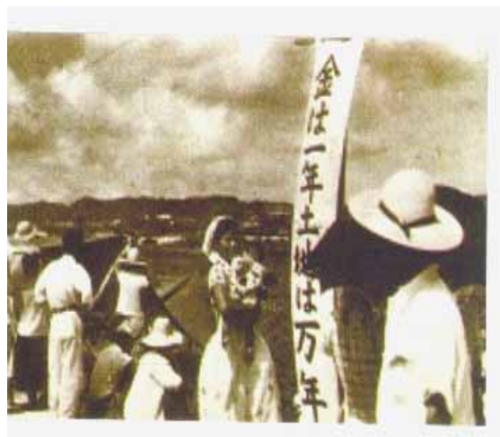
米軍の強制土地接收に対する闘争。