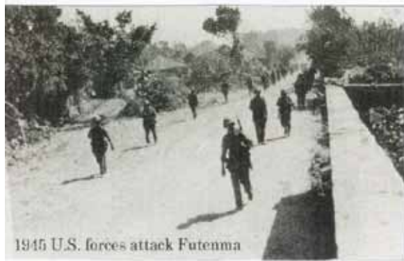
1945年 米軍が普天間に上陸。

沖縄は1945年に第二次世界大戦の最後の激戦地となりました。補給部隊を含めると約55万人の米軍連合部隊が参加した沖縄上陸作戦(アイズバーグ作戦)は、1945年3月23日から上陸のための空襲を始め、翌24日から艦砲射撃が始まり、参加艦船約1500隻、兵員18万3000人で26日に慶良間(ケラマ)諸島、4月1日に沖縄本島中部西海岸に上陸を開始しました。沖縄本島に上陸した米軍は、圧倒的な兵力で大量の砲弾を撃ち込み3ヶ月にわたる激しい戦闘で沖縄本島中南部を破壊して6月末までに沖縄全土を支配下におきました。