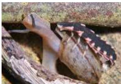
マイマイを襲う オキナワマドボタルの 幼虫▶