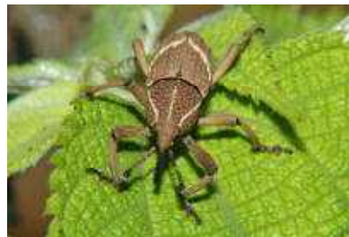
クニヨシ シロオビソウムシ▶