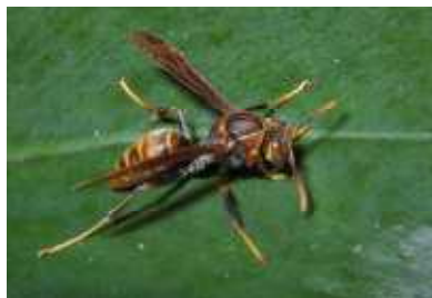
◀ヤマトアシナガバチ