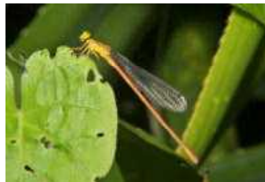
◀リュウキュウ ベニイトトンボ