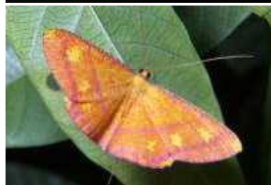
オビヘニホシヤク▶