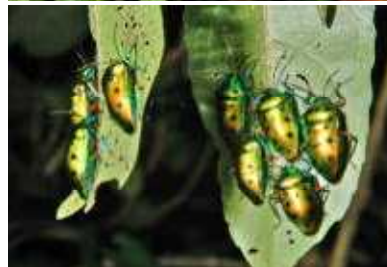
◀ナナホシキンカメムシ