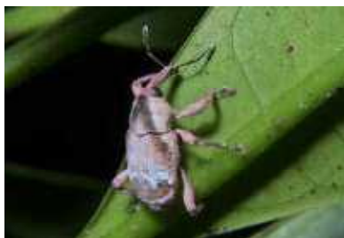
ヒラヤマ メナガソウムシ▶