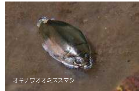
オキナワオオミズスマシ

ゲンゴロウをまねたマイクロマシンの開発が進んでいます。この機械は、直径5mmの管の中を高速に移動することができるので、様々な配管の内部検査への利用が期待されています。また、その進化型としてバッテリーもモーターもいらぬ、外部磁界で動くマイクロマシンの開発も行われていて、医療分野での利用が期待されています。