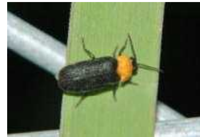
オキナワスジボタル▶