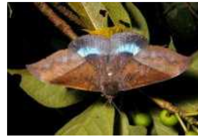
オオルリオビクチバ▶