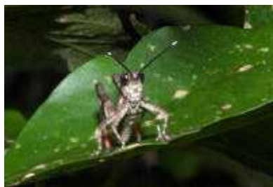
◀オキナワモリバッタ