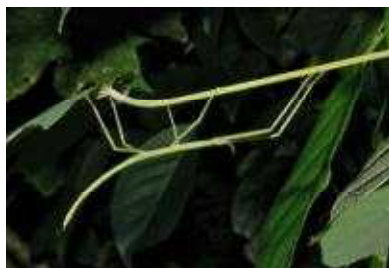
◀オキナワナナフシ