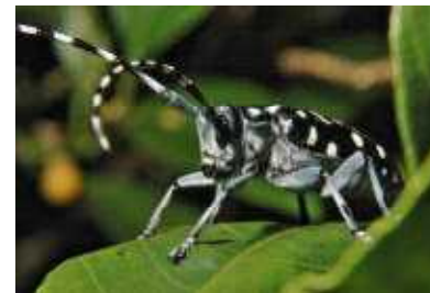
ゴマダラカミキリ▶