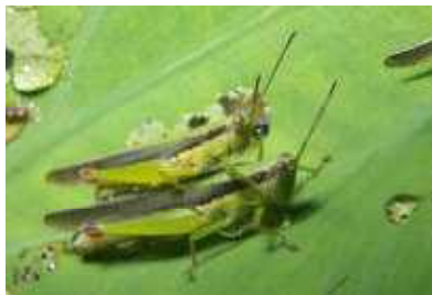
◀オキナワイナゴモドキ