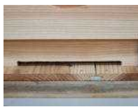
▲ハチ箱のハチの出入口