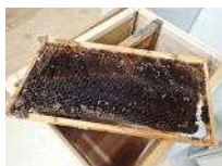
▲巣房をつくらせる木枠