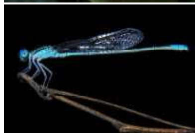
ムスジイトトンボ▶

大山地区は、国道58号線から海岸側にある海岸段丘地の下になります。段丘面からの湧き水が豊かで、段丘下から海岸まで湿地となっています。豊かな水環境と、様々な水生植物が都心近くとは思えない風景をつくりだしています。ここでは222種類の昆虫類が記録されています。