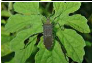
◀アシビロヘリカメムシ